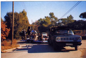
Un buen anuncio requiere muchas horas de trabajo delante los focos. La ventaja en este caso es que tenían la merienda asegurada.